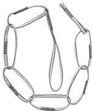
Daisy chain "Лайт"