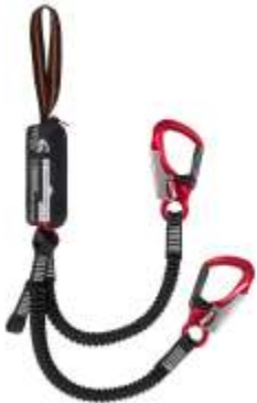
Самостраховка "Виа феррата про"